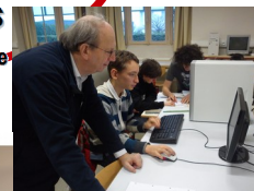
Suivi des projets par un ingénieur

Les outils numériques sont systématiquement mis en œuvre en Sciences de l'Ingénieur :